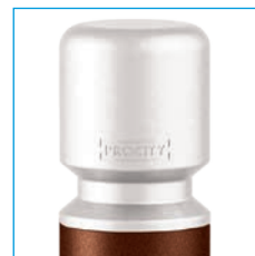
Système d'amovibilité pour potelets Serrubloc® 21