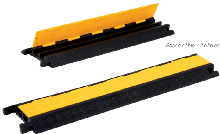
Passer câble - 2 câbles