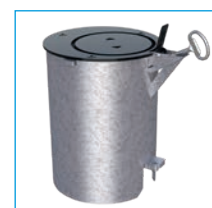
Fourreau d'amovibilité verrouillable