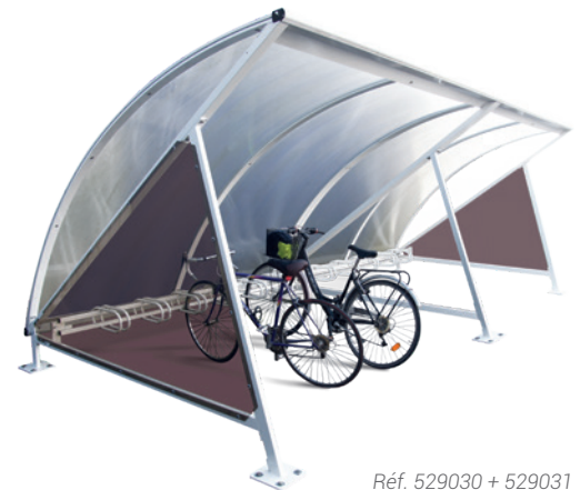
Réf. 529030 + 529031