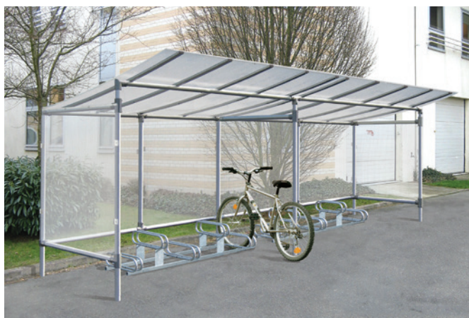
Réf. 529265 + 204719 + 529261 + 529271