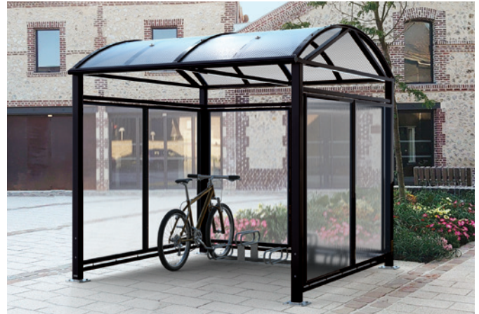
Réf. 529082 + 204719