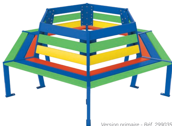
Version primaire - Réf. 299035