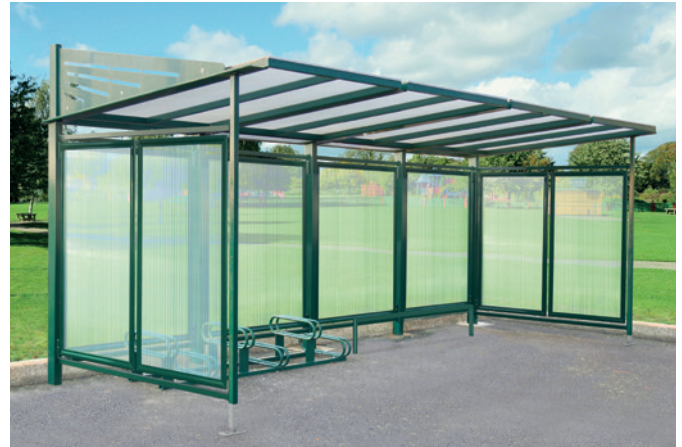
Réf. 529614 + 204105 + 204711