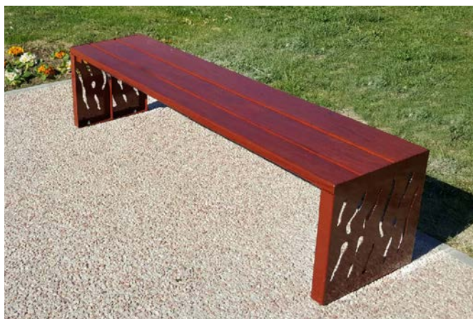
Version acier et bois - Réf. 209169