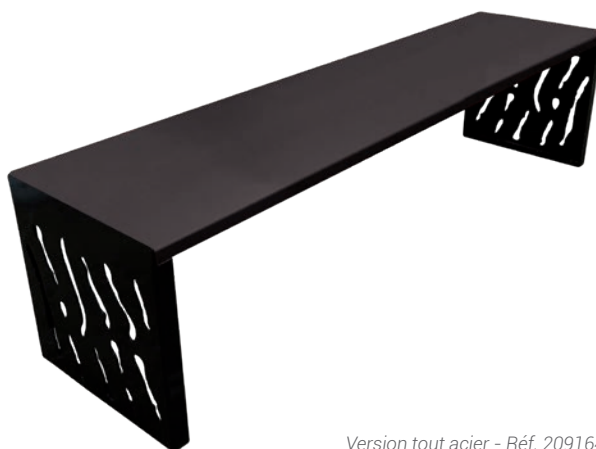
Version tout acier - Réf. 209164