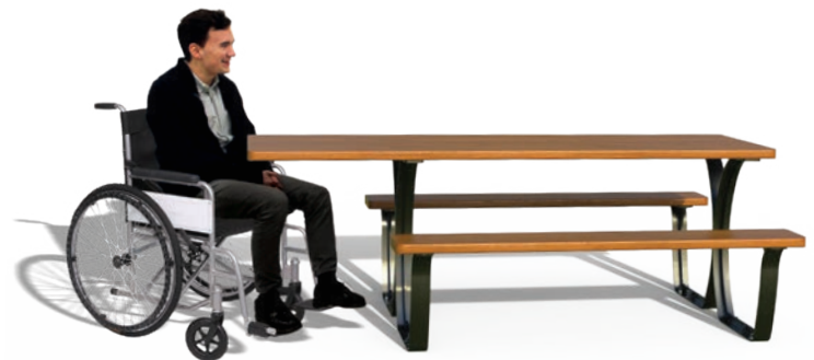
Table Séville PMR* Réf. 209469