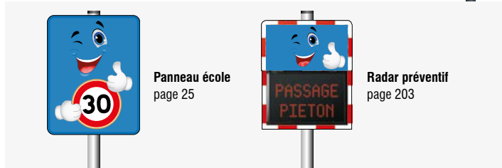
Panneau école page 25