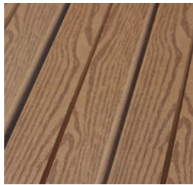
ECO-COMPOSITE COULEUR BOIS FONCÉ

Barres en eco-composite disponibles en couleur bois foncé , couleur bois clair et en couleur verte .