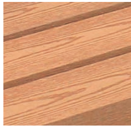
ECO-COMPOSITE COULEUR BOIS CLAIR