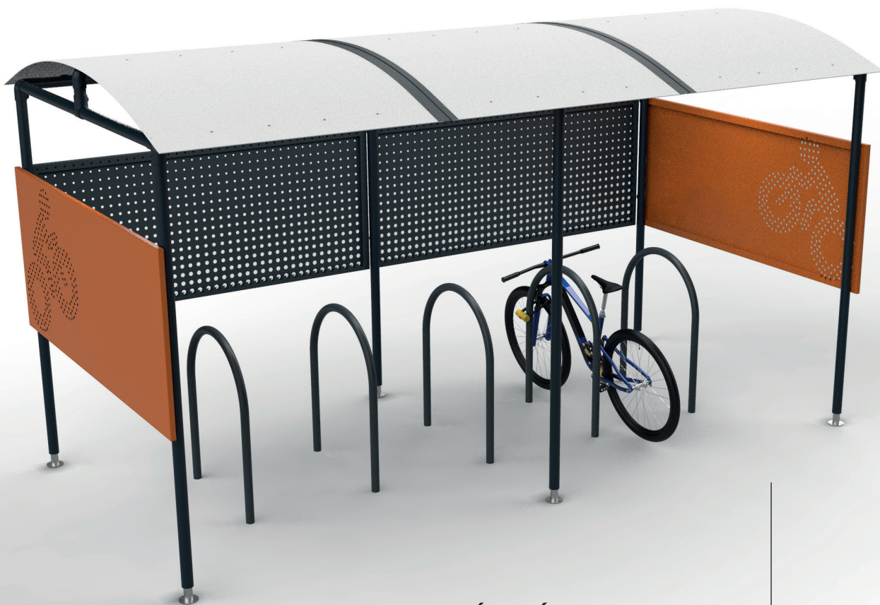
ABRI TOUT ÉQUIPÉ