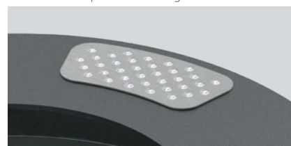
Option écrase cigarette - Réf. 208181