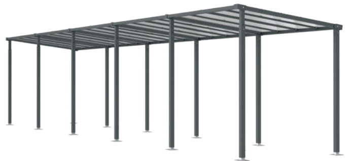
Réf. 529255 + 529256