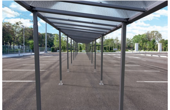
Réf. 529255 + 529256