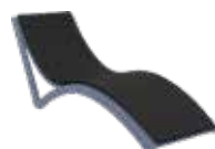
Coussin en option