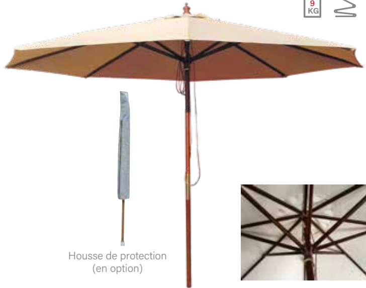
Housse de protection (en option)