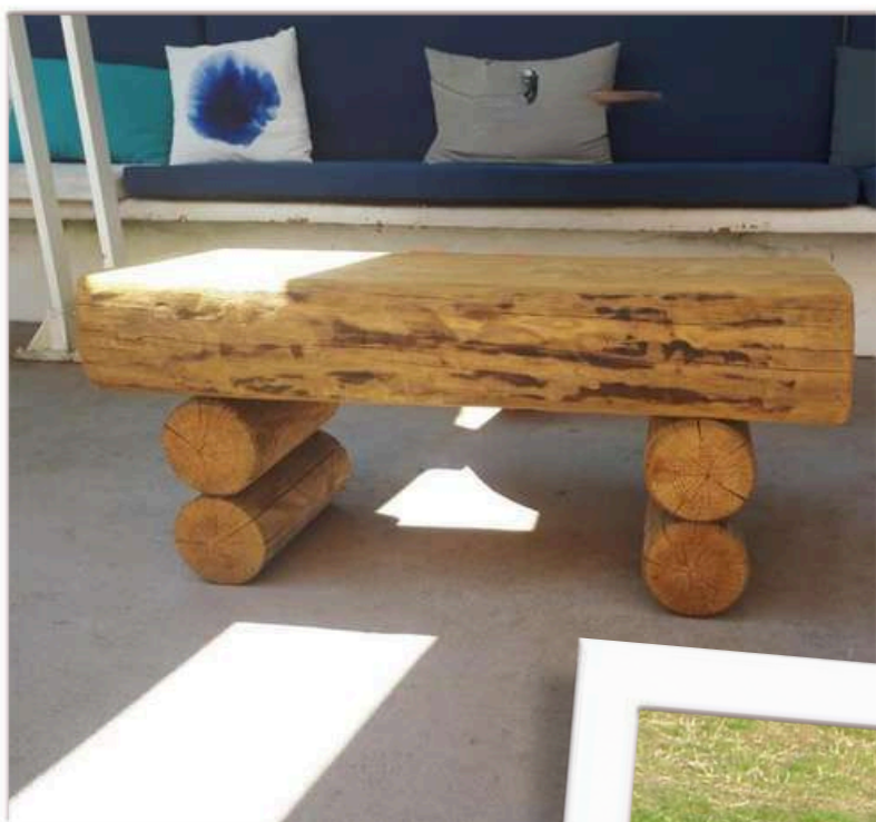
Banc Forestier 1 m

Avec ou sans dossier, ce banc constitué d'un 1/2 billon de pin est gage de résistance , de confort, et offre un cachet alliant nature et élégance.