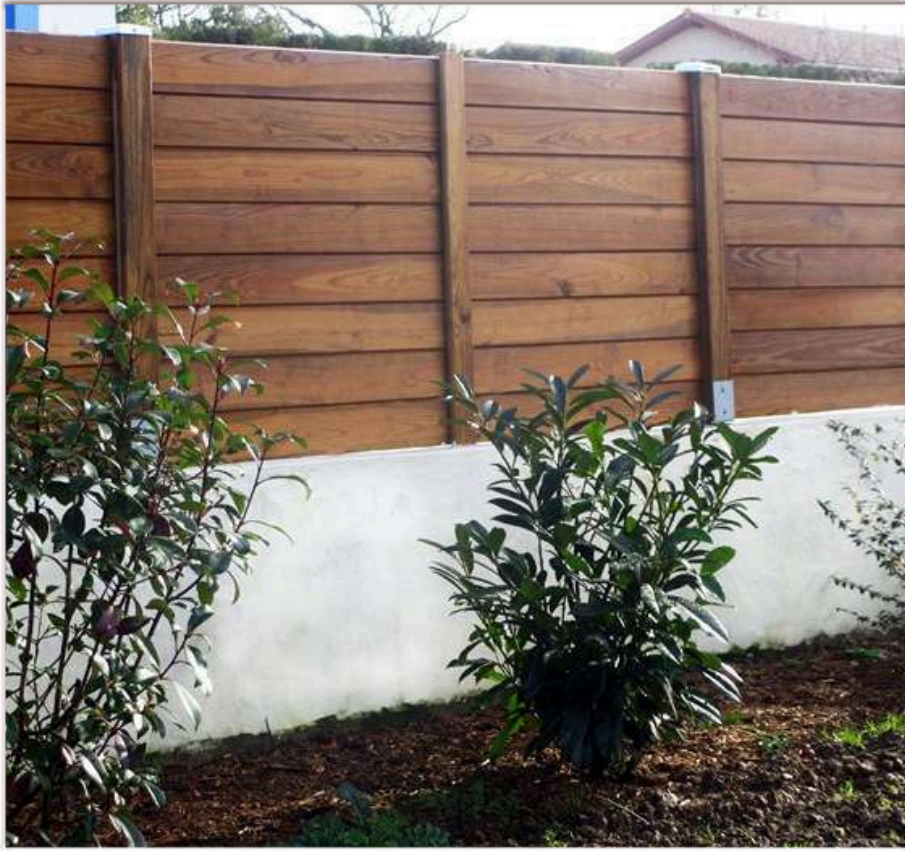
Clôture rainure languette