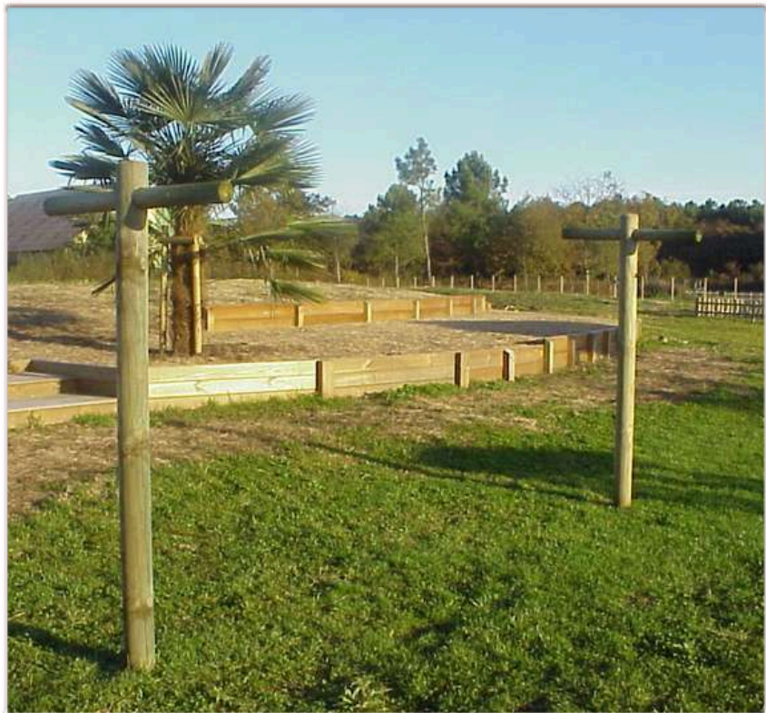
Etendoir à linge