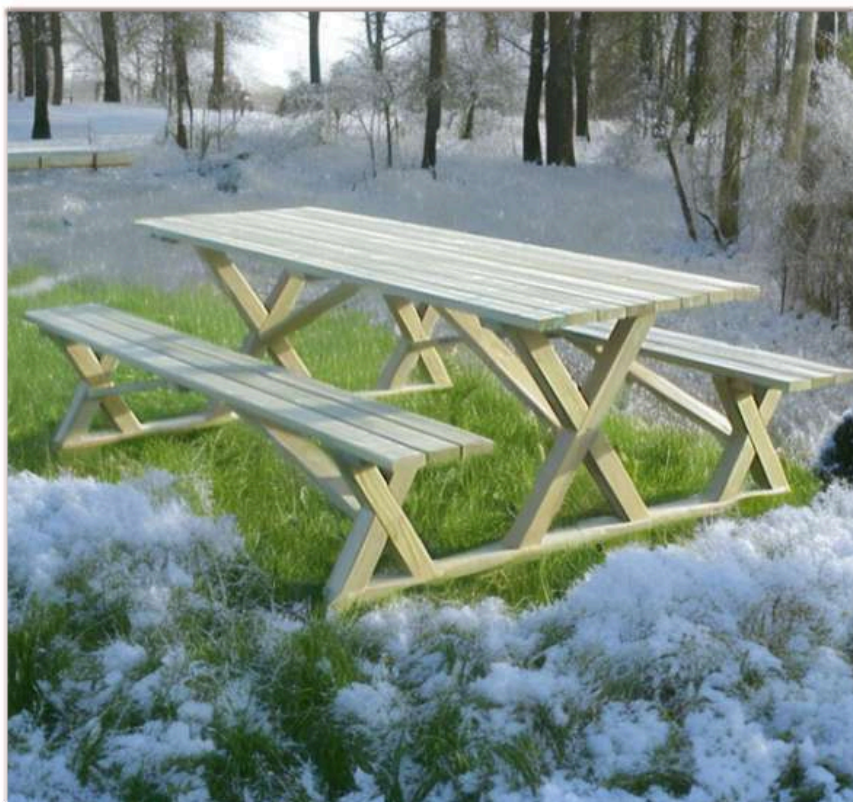
Table St Lary

Cette table aux pieds croisés est une alternative à la traditionnelle table de pique-nique.