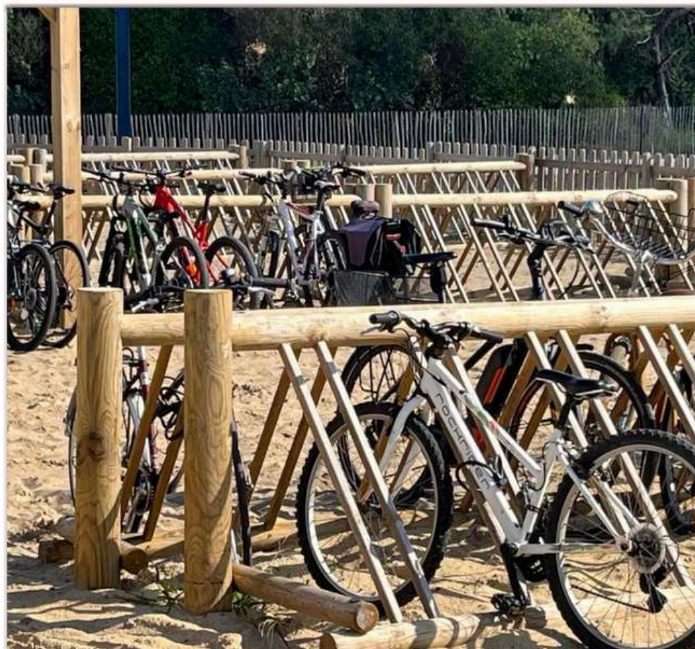
Nos racks à vélos