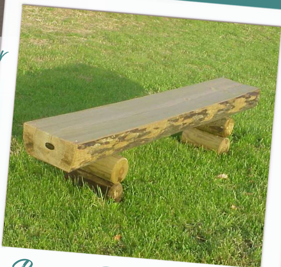
Banc Forestier 2 m