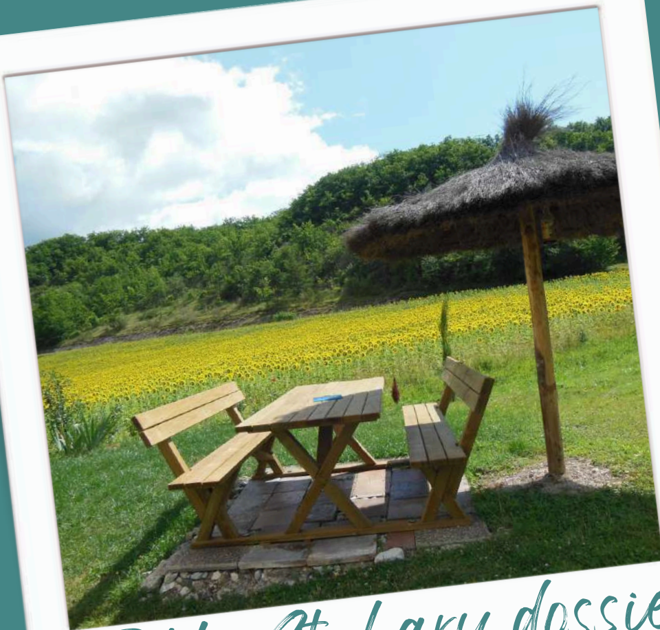
Table St Lary dossier