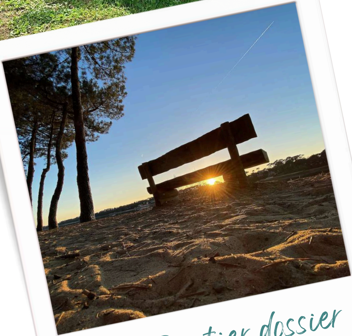
Banc Forestier dossier